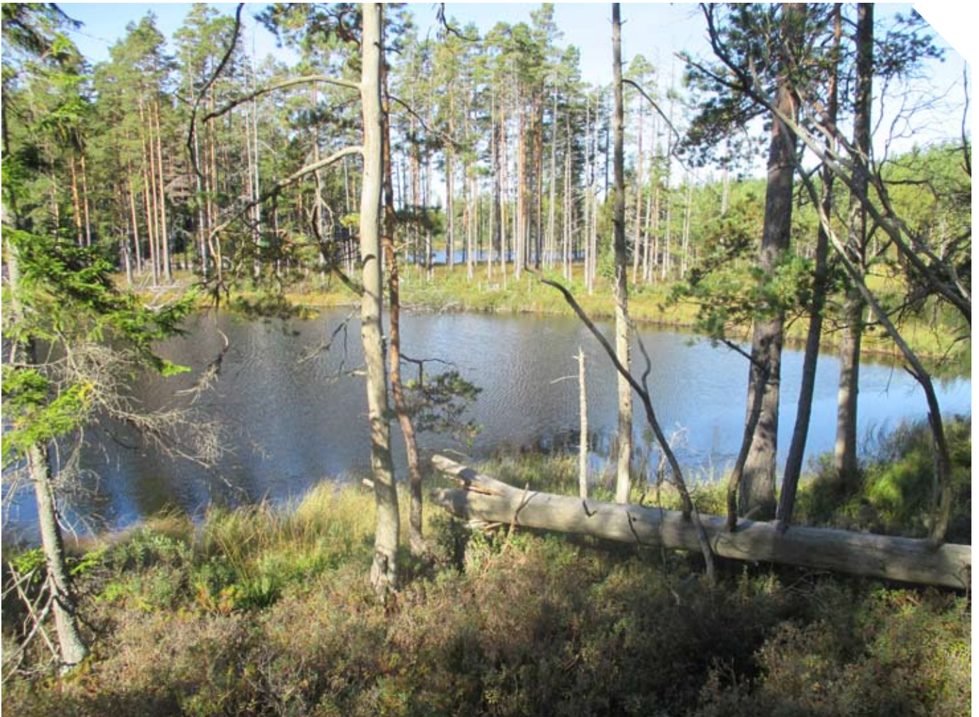
Trakten norr om Gryt